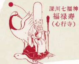
深川七福神 福祿寿 (心行寺)