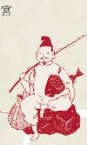
深川七福神 恵比寿神 (富岡八幡宮)