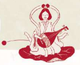
深川七福神 弁財天 (冬木弁天堂)